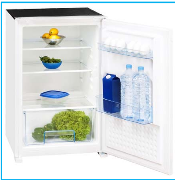
EKS 145-11 RVA+