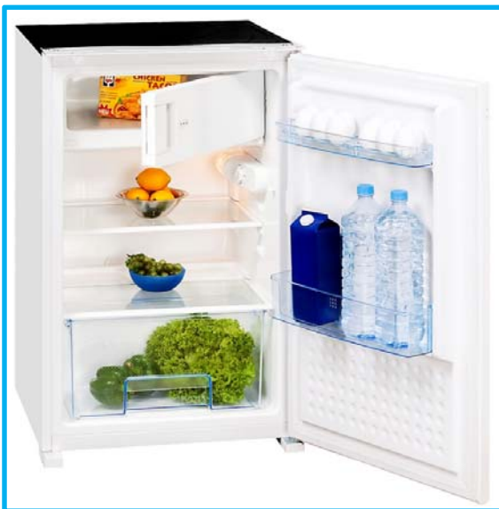
EKS 145-11 A+